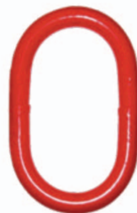
Anneau de tête